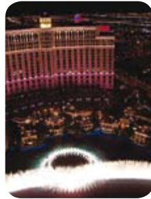
미국 벨라지오 카지노

Victaulic 솔루션은 월등한 설계 상의 유연성, 지진에 견딜 수 있는 능력, 소음 및 진동 감소, 시스템에 대한 접근성, 시스템의 확장성, 설치의 편의성 및 서비스 등 많은 이점을 제공합니다.