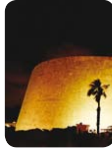
이집트 알렉산드리아 도서관