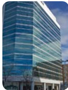
캐나다 ADOBE 타워