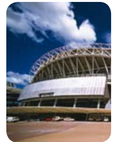
호주 시드니 올림픽 스타디움