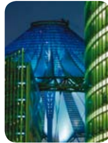
독일 소니 센터