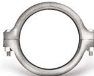
최대 압력 300 psi/2065 kPa의 스테인레스용 고정식 커플링