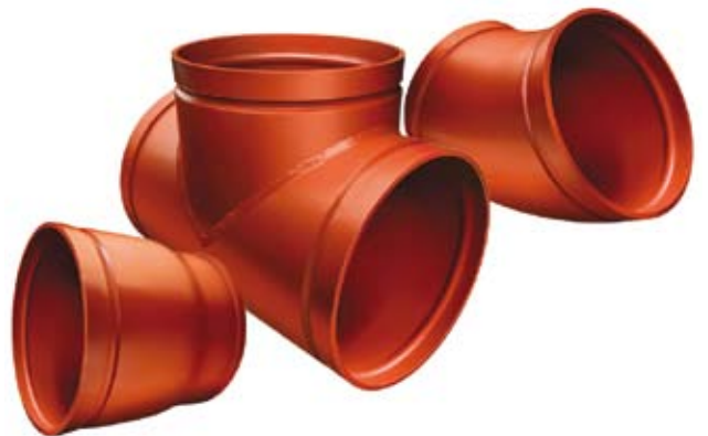
AGS 피팅류 그루브 가공된 피팅은 엘보, 티, 및 레듀서를 포함합니다.