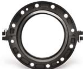
AGS Vic-Flange® 어댑터는 ANSI CL. 125/150 플랜지입니다