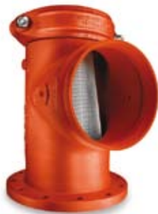
석션 디퓨저 및 스트레이너는 펌프와 장비를 보호하는 데 적용합니다.