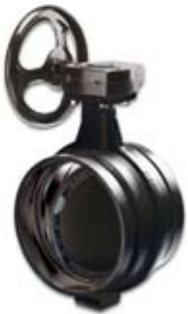
버터플라이 및 체크 밸브는 다양한 용도로 적용이 가능합니다

두 개의 하우징, 두 개의 볼트 및 360°의 견고한 체결은 신속하고 강력한 체결을 가능하게 합니다.