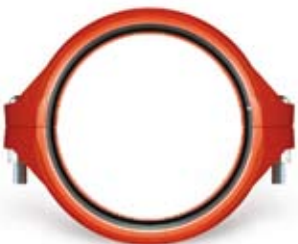
고정식 및 플렉시블 커플링으로 공급 가능, 최대 350 psi/2410 kPa 사용 압력